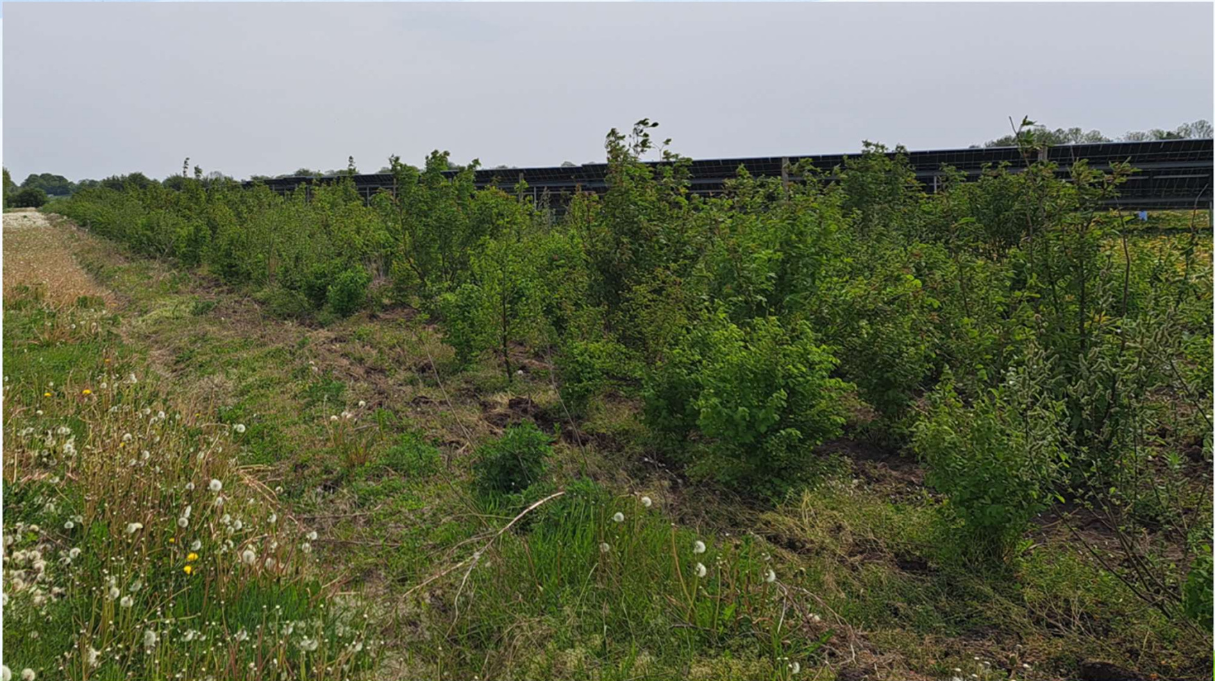
Vest for Hjolderup, langs med Hellevad - Bovvej. Foto fra 21. maj 2023