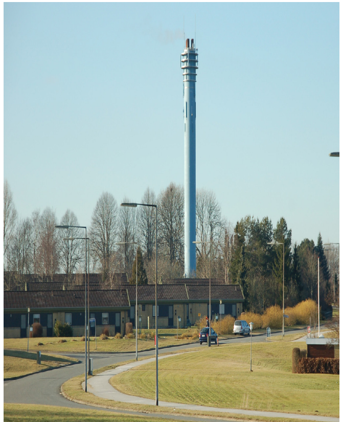
Billede: Billundkvarteret i Vojens