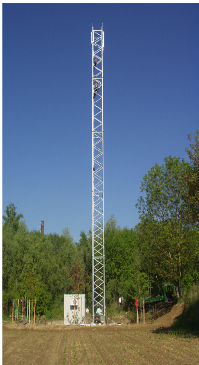
Billede: Gittermast med teknikkabine

Gittermaster er billigere at fremstille end f.eks. rørmaster. Gittermaster benyttes ofte i sammenhæng med positioner, hvor mastens udseende ikke har stor indflydelse på landskabet.