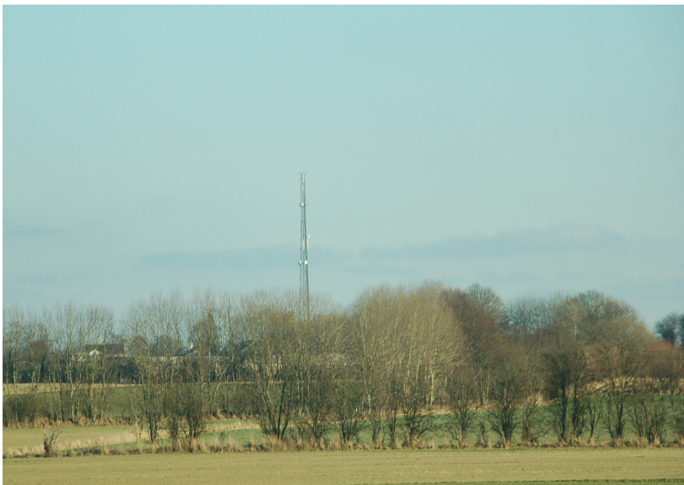
Billede: Gittermast i åbent land