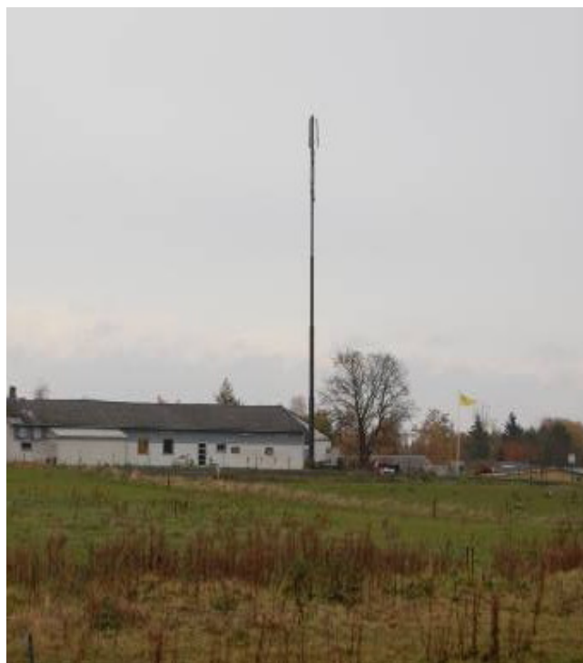
Billede: Mindre rørmast på p-plads

Haderslev Kommune ønsker generelt, at nye master der søges placeret i byområder skal være udformet som rørmaster (der henvises til afsnit 6, generelle principper, pkt.7).