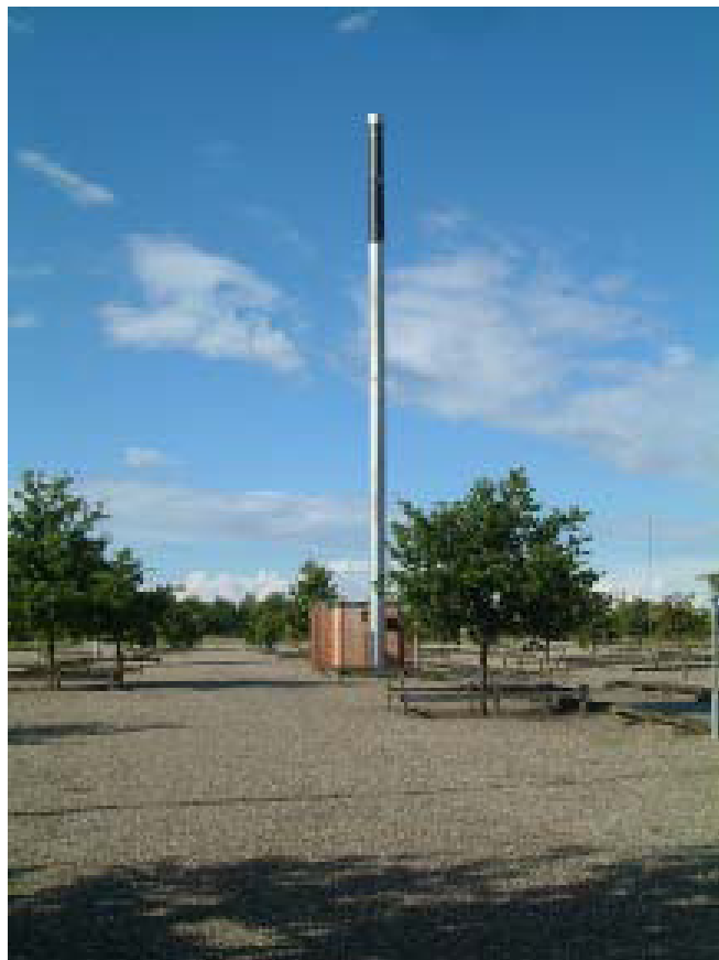
Billede: Rørmast på p-plads