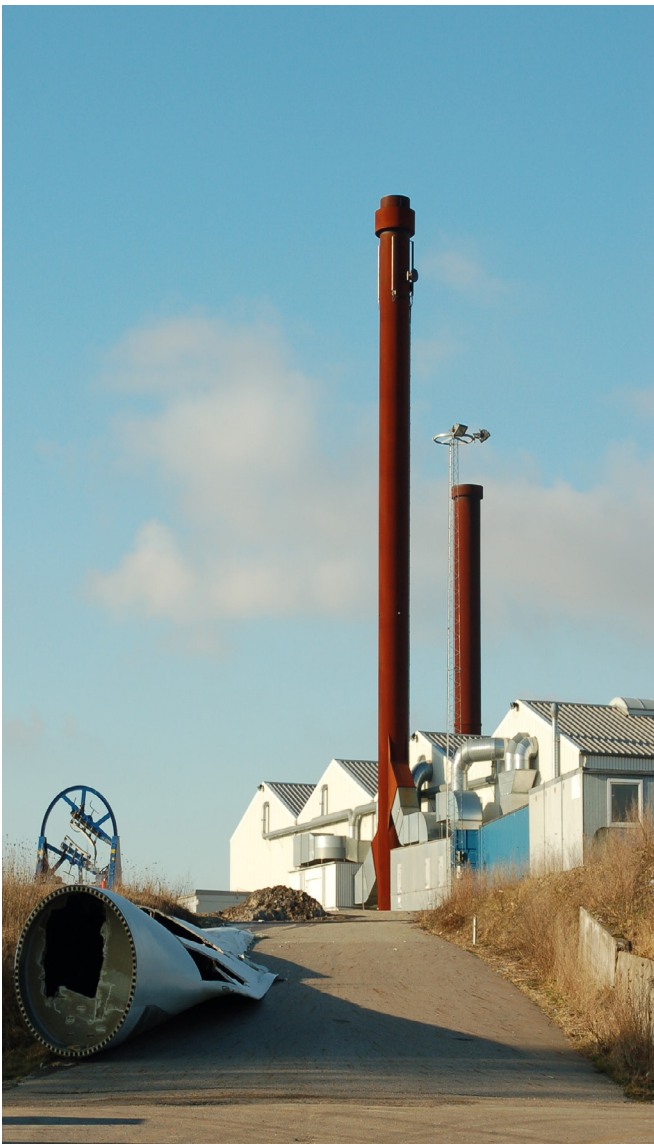
Billede: Industrikvarter i Hammelev