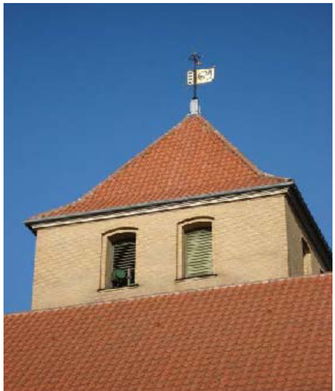
Billede: Antenne tilpasset kirkespir