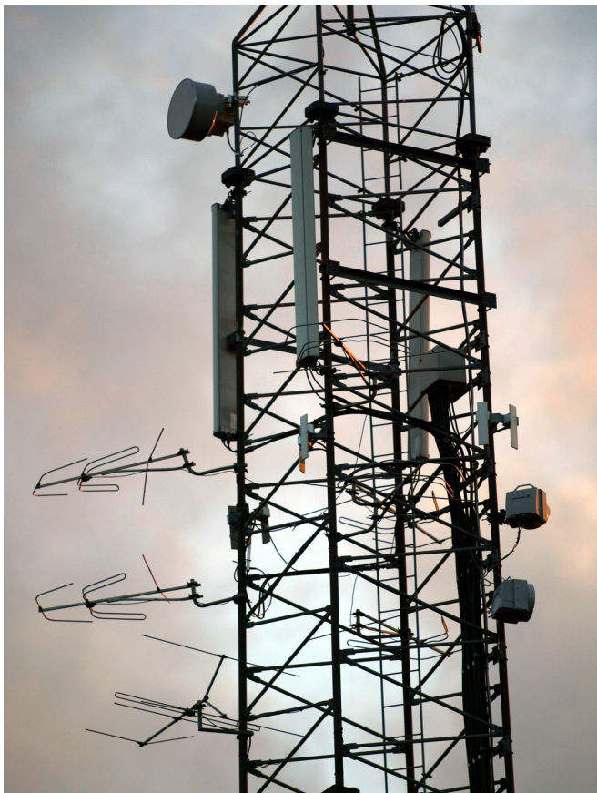
Billede: Gittermast med flere antenner