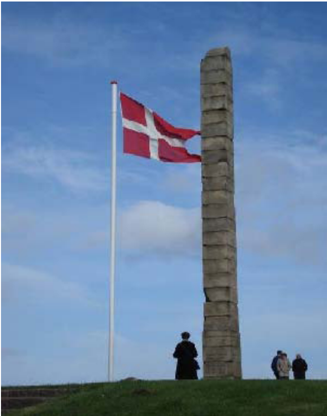
Billede: Flagstangsmast Skamling

Radiobølger kan ikke trænge igennem materialer som mursten, tagsten, eternit, træ og glas. Kamouflerende konstruktioner udføres derfor ofte i glasfiber/plast eller plexiglas.