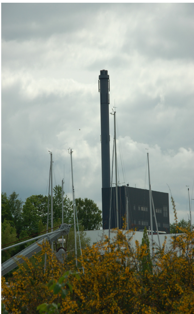
Billede: Antenner på skorsten

Ulemperne er, at det kan være vanskeligt at finde plads til teknikrum i eksisterende bebyggelse, da disse ikke er indrettet til dette formål.