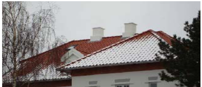
Billede: Antenne kamufleret i skorsten

Et andet eksempel er at kamuflere en sendemast som en "flagstang". En hul glasfiberstang bygges op om et bærerør. Antennerne placeres inden i det hule glasfiberrør. En sådan "flagstangsatrap" har dog en begrænset bæreevne, og kan kun etableres i begrænset højde og med få antenner.