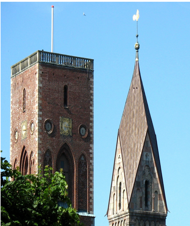
Billede: Flagstangsmast på Ribe Domkirke